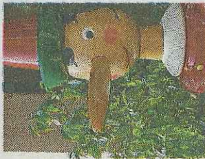
Sabato si festeggia Carlo Lorenzini