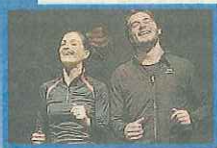
Teatro Puccini domani e sabato ore 21