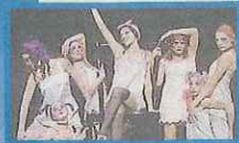
Teatro Antella domani Info: 335 6117071

Biblioteca delle Oblate Lunedì 2 dicembre ore 17